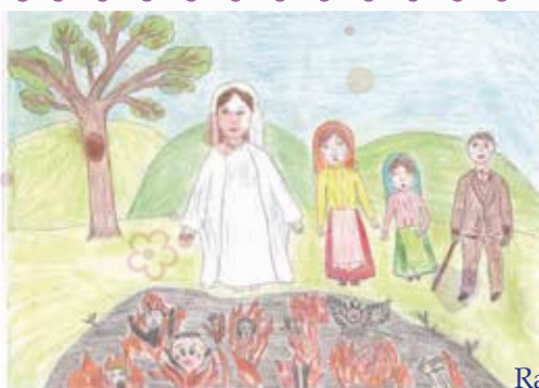
Rajzolta: Kovács Mária

Hogy nevezzük a bűnösökért vállalt lemondásokat, imádságot?